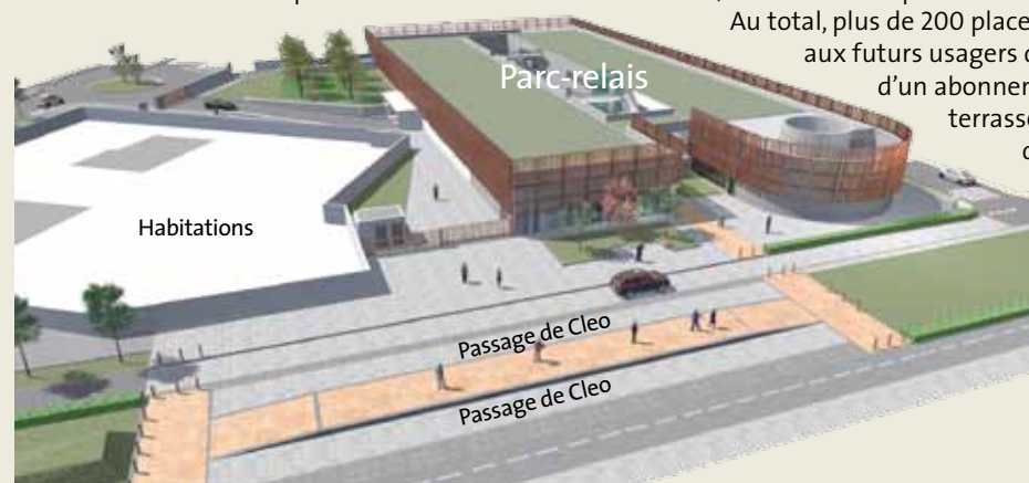
La future station Clos du Hameau

Le quartier du futur terminus « Clos du Hameau » de la nouvelle ligne de tramway se dessine lui aussi. Les travaux du parc-relais ont démarré mi-octobre pour environ un an et demi. Avec eux, c'est tout un espace dédié aux déplacements qui prend vie.