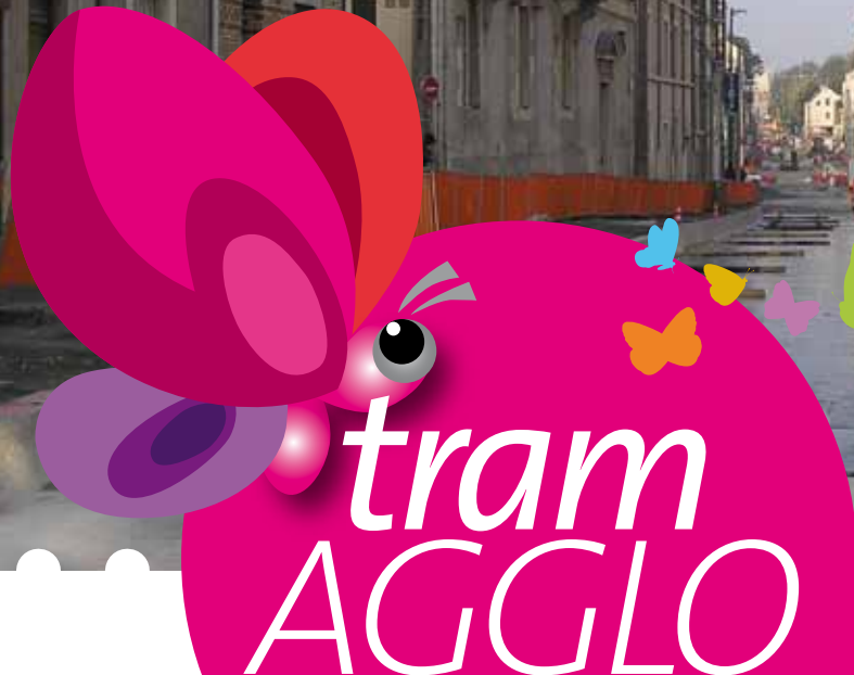
Faubourg Madeleine : mise en place du tapis antivibratile pour la pose de voie en dalle flottante.