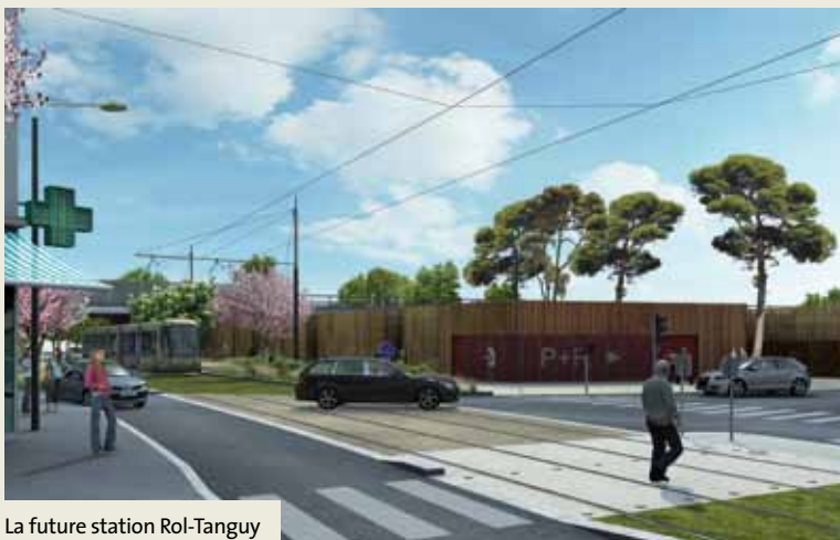
La future station Rol-Tanguy

Les travaux de Cleo progressent et avec eux, de nouveaux quartiers sont créés, d'autres sont embellis ou repensés. Car c'est aussi ça l'effet Cleo ! Des secteurs mieux desservis où la circulation est apaisée et facilitée pour les piétons et les vélos, des espaces encore plus agréables à vivre et animés, et le ruban vert de la plateforme engazonnée qui apporte de la nature en ville. Alors, en cette période de chantier intense et difficile, laissons-nous aller à rêver un peu en découvrant quelques uns de ces aménagements qui bientôt nous changeront la vi(II)e.