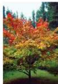
Erable japonais (Acer palmatum)