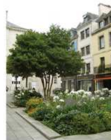
image de référence de massifs plantés