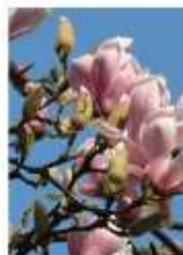
Force à la plantation: Tige solitaire 20/25