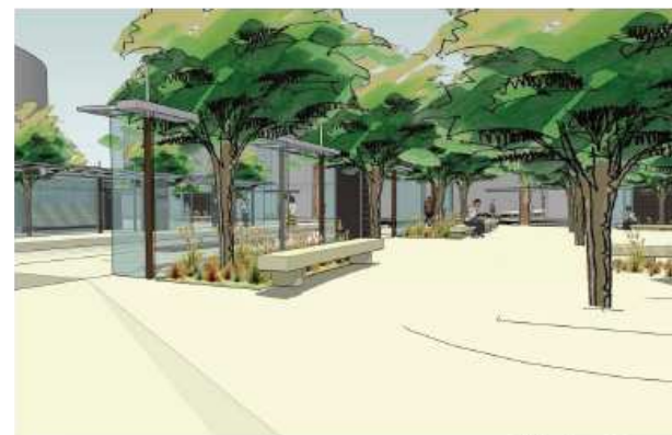
Abri place De gaulle