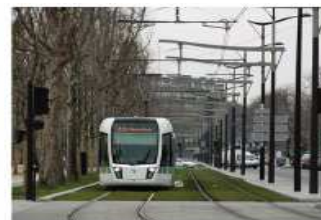
pavé granit - plateforme engazonnée