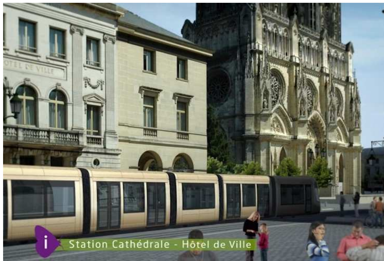
Station Cathédrale - Hôtel de Ville