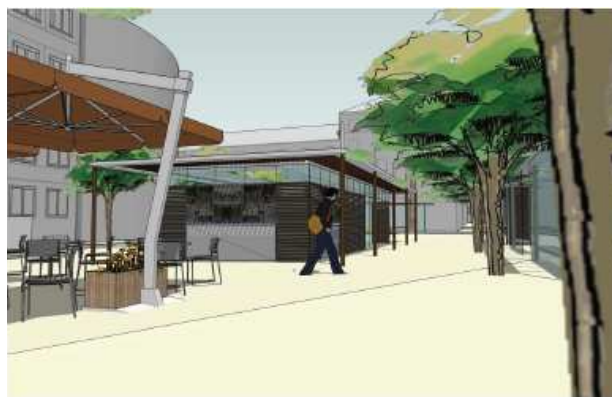
Kiosque place De gaulle

Kiosque et abris voyageurs, le choix d'un mobilier confortable et moderne