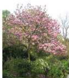
Magnolia caduc (Magnolia x soulangeana)