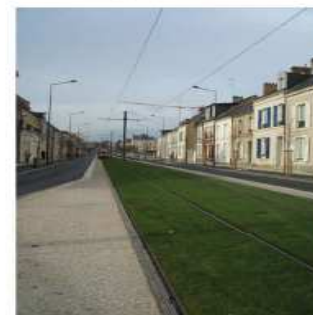
béton désactivé - plateforme engazonnée