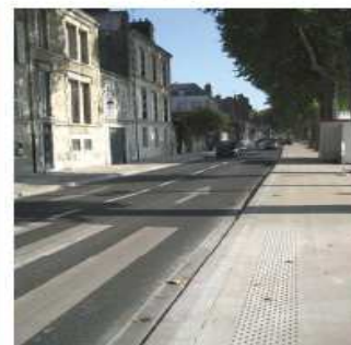
béton désactivé - enrobé voirie