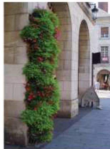
image de référence Orléans