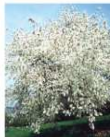
Amélanchier (Amelanchier lamarckii)