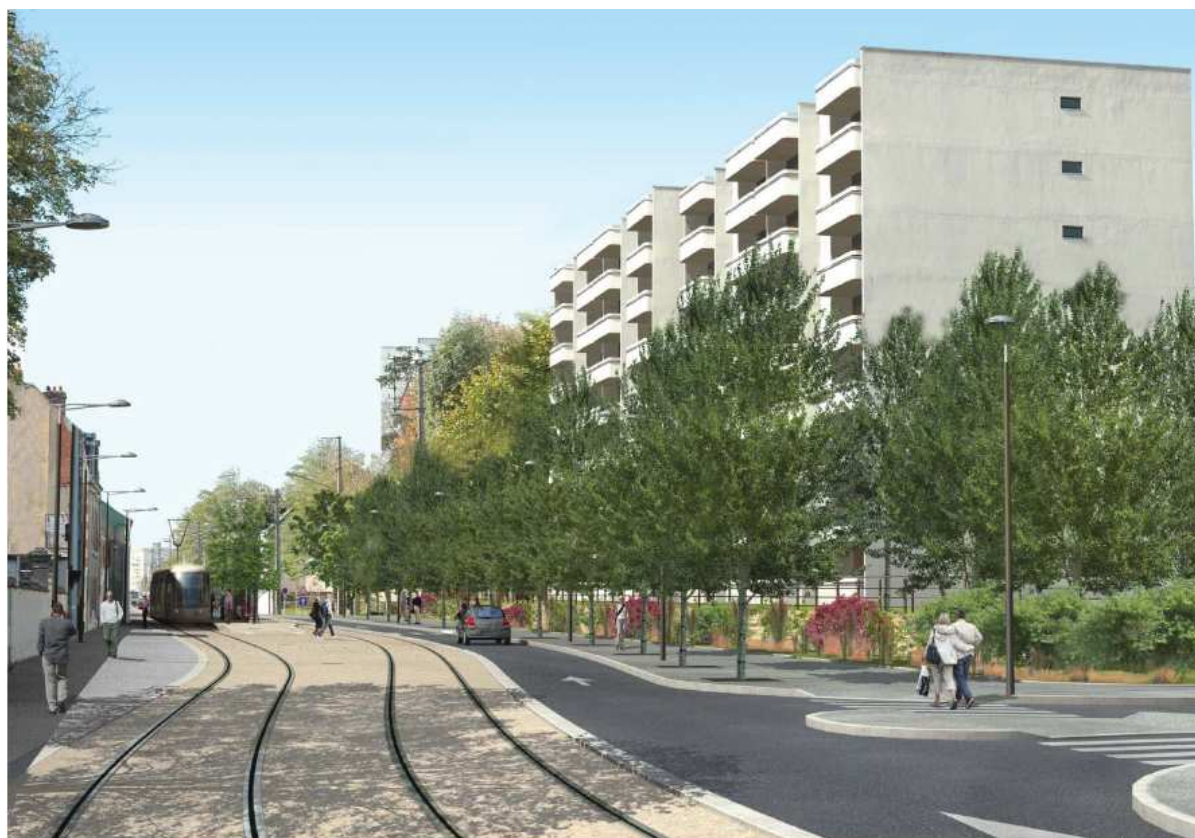
perspective décembre 2008