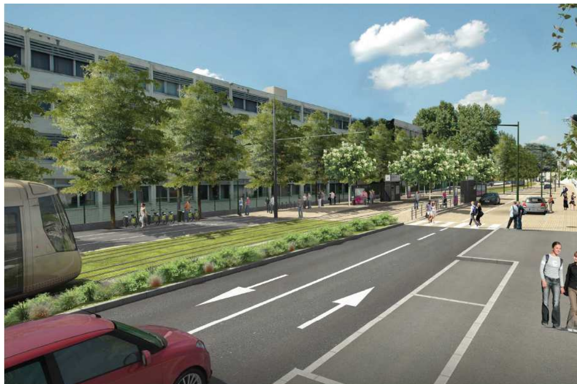
Rue Eugène Vignat