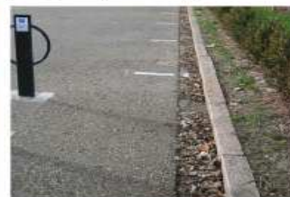
enrobé voirie ocre gris