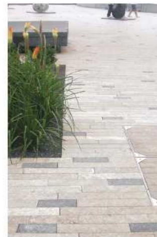
pavé calcaire grand format

Des matériaux adaptés qui révèlent l'espace. La pierre investira l'espace public du cœur historique avec noblesse et élégance.