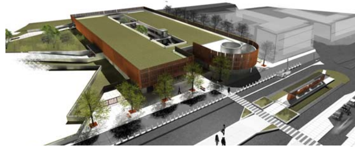
Pôle d'échanges de Saint-Jean de Braye